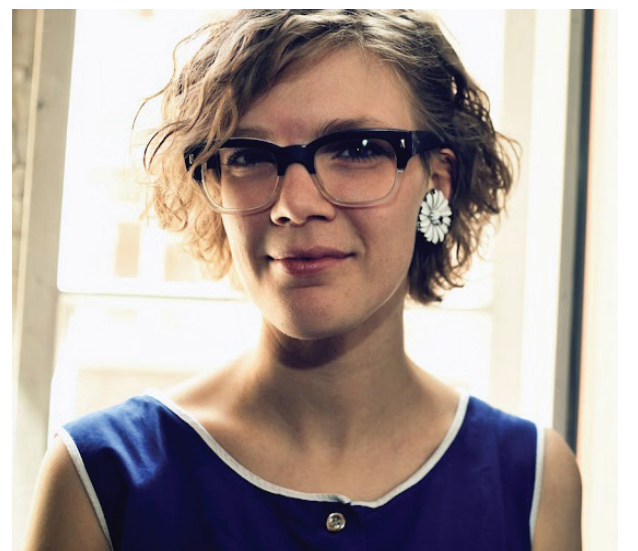
Rødt-nestleder: Marie Sneve Martinussen.

– De rødgrønne har hele veien sagt at de ikke vil innføre finansskatt før EU eventuelt gjør det, i frykt for at det vil virke for ødeleggende for den norske finanssektorens konkurransevne. Nå viser Frankrike vei og de rødgrønne bør hente forslaget opp fra skuffen igjen, sier Sneve Martinussen. – De som ble rike på krisa må i større grad tvinges til å bidra til felleskassa. Innføring av finansskatt ville vært et stort skritt i riktig