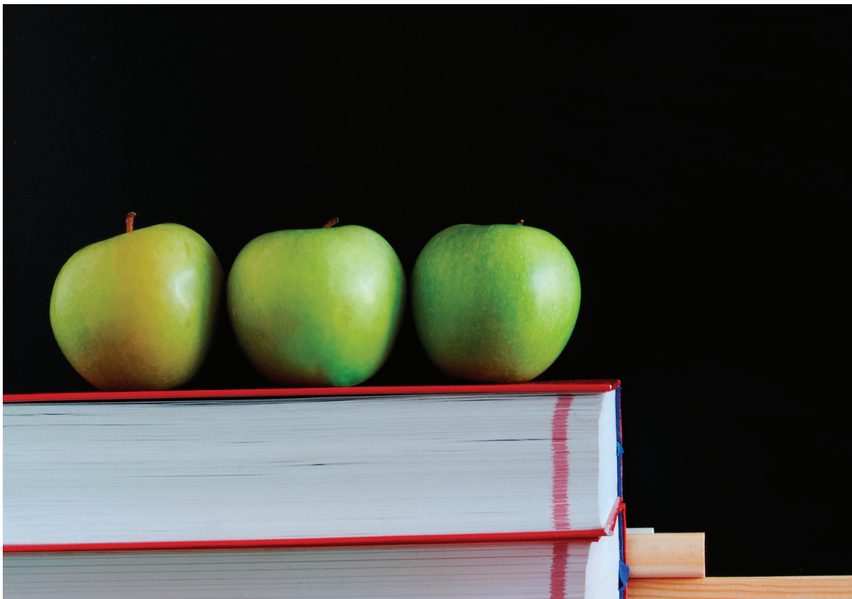
Sårbar økonomi: Når pengene skal følge eleven blir det vanskelig å drive langsiktig pedagogisk arbeid.