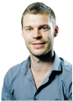
Bjørnar Moxnes b.moxnes@gmail.com leder i Rødt