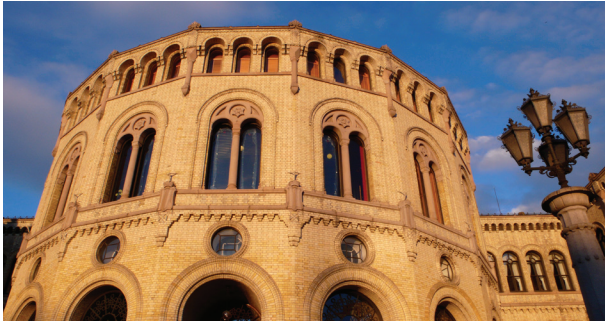
Stortinget: Fersk måling gir Rødt tre mandater.