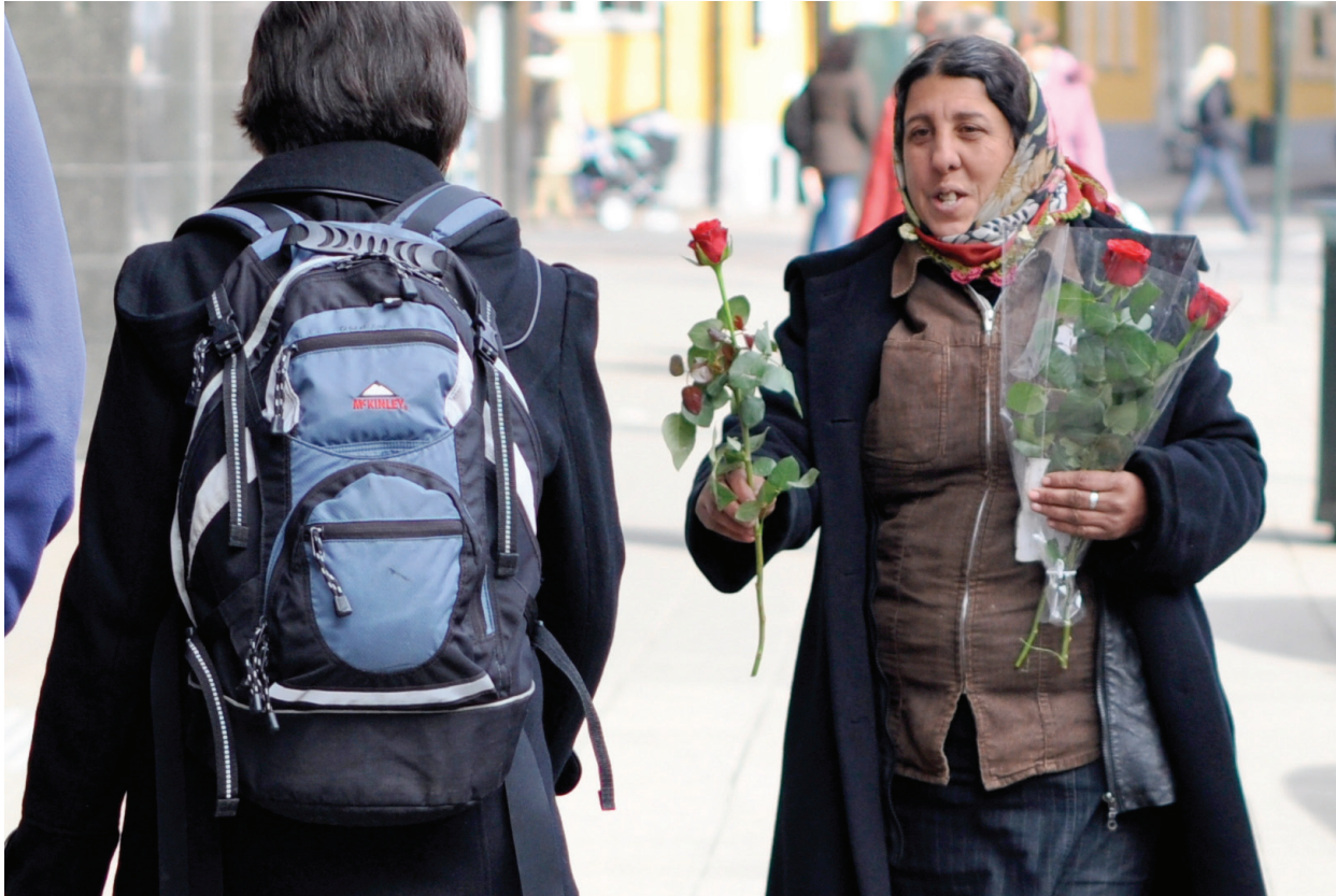
Romfolket: Opplever diskriminering i Norge.