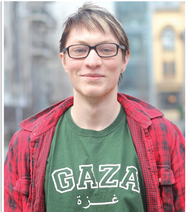
Skulepolitisk ansvarleg: Morten Haugland Almås.

– For å unngå dette er det viktig at flest mulig får best mulig kjennskap til arbeidslivet før vi kastes ut i det. På ungdomsskolenivå foreslår vi å integrere dette i samfunnsfagundervisningen, med fokus på jobbsøking, kontraktskriving og allmenne rettigheter for arbeidere. I 1 klasse vgs foreslår vi obligatorisk skolebesøk ved representanter fra fagforbund. På yrkesfag vil det være naturlig med de forbundene som representerer yrkesretningene elevene utdanner seg i. Dette ville vært et godt supplement som forhåpentligvis sørget for at resultatene fra LOs sommerpatrulje bare vil bli mer positive i framtida.