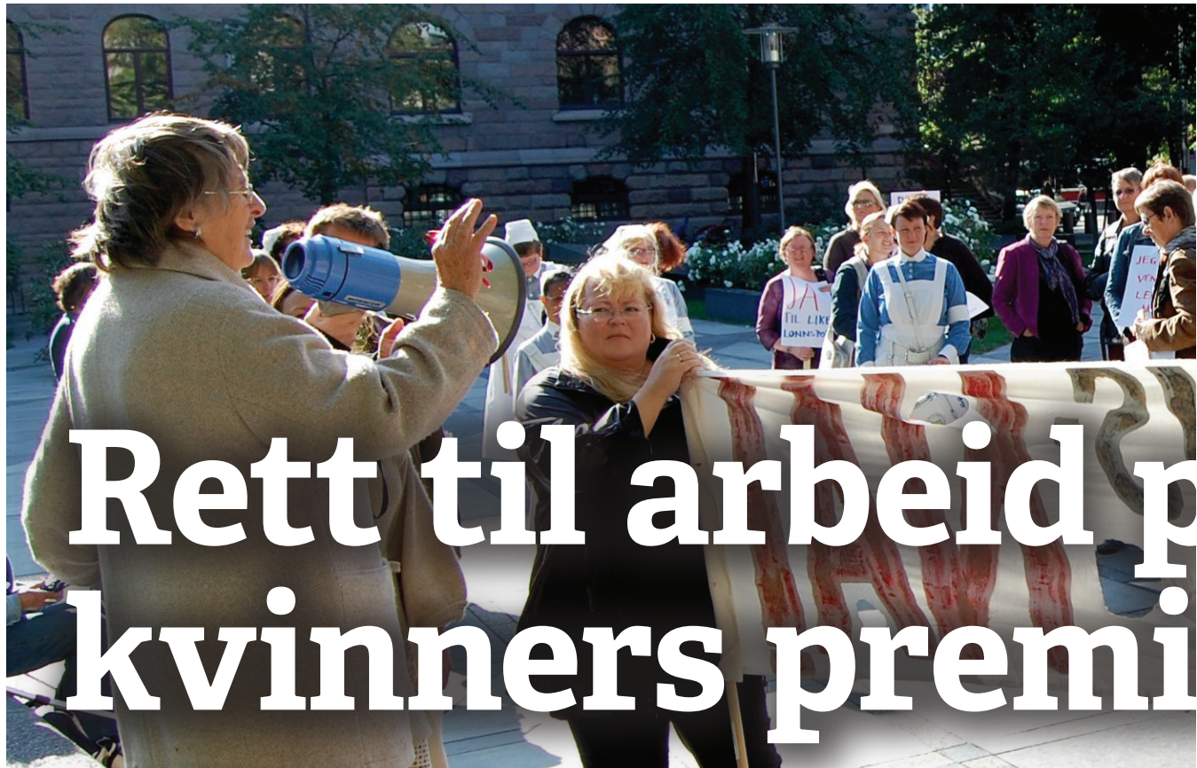
Rett til arbeid: Årets Kvinner på tvers-konferanse fokuserer på kvinners rett til arbeid.

Utgiver: Rødt Osterhaus' gate 27 0183 Oslo