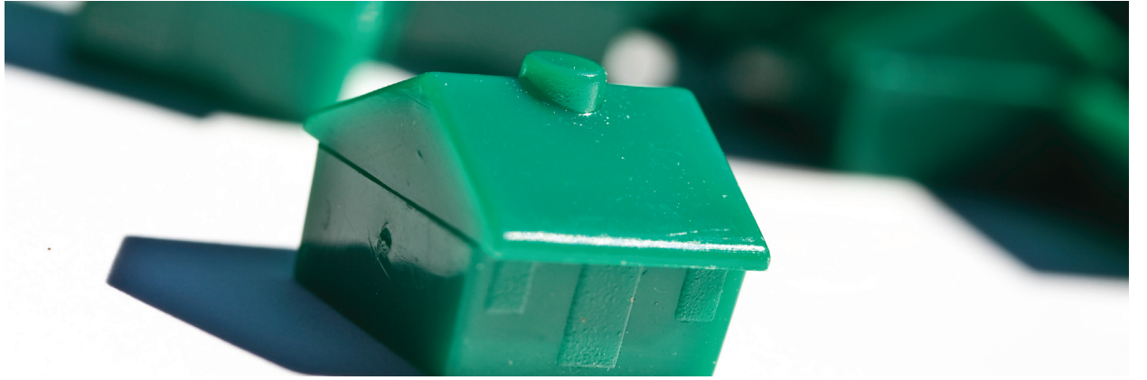
Boligkrisa: Lar seg ikke løse innafør markedet.